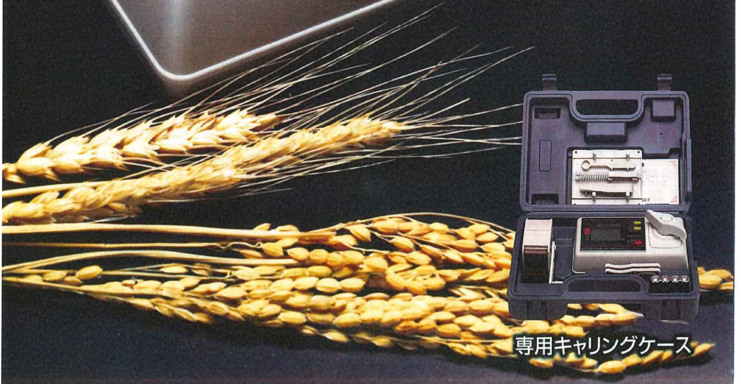
専用キャリングケース