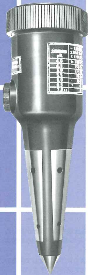
土壤酸度測定器 DM-1型 (pH3.0~7.0)