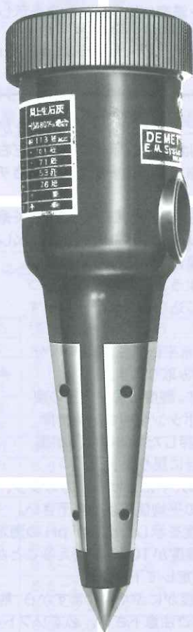
土壤酸度測定器(普及型) DM-3型 (pH3.5~7.0)