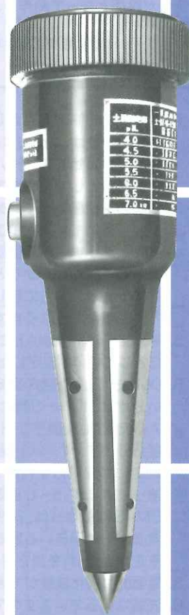
土壤酸湿度測定器 DM-5型 (pH3.5~7.0) (水分0~100%)