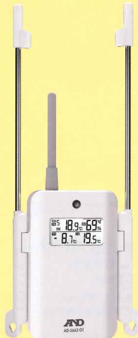
子機 (外部センサー・送信機)