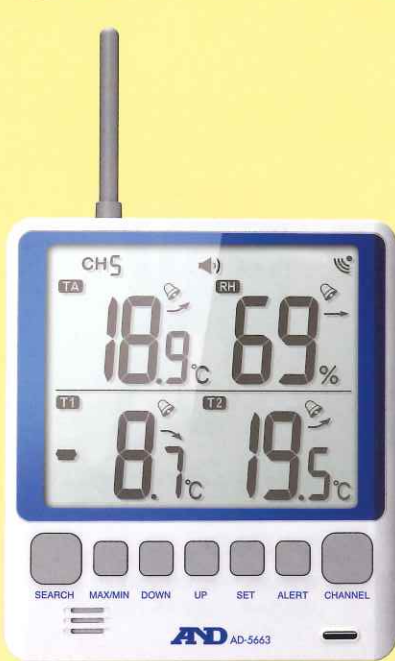
親機 (表示器・受信機)